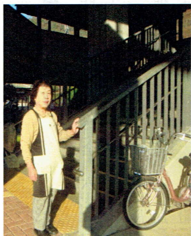
久崎駅で作業されている風景

いたずらが多く、心ない人のゴミの不法投棄や子供の落書きなどのいたずら等、予想もしなかった事に悩まされた。でも、利用される方々が智頭急行が開通して便利になったと喜んでおられる様子を見ると、少しでも気持ちよく旅をしてほしいと思い、野の花一輪を洗面所に飾りお客さんとの会話にも心がけました。気の進まない事、私自身もそうなんです。色々な気持ちで利用していただきます。心配事で気持ちの重い人、楽しみいっぱい同窓会に出かける人、今日は孫に会いに行くところですか、楽しい時は皆さんの方から教えて下さいませ。仕事から得たことは勉強になる事ばかりでした。運動にもなつて今、健康でいられるのも仕事があればこそと感謝して、これからも利用されるお客様のマナーに守られて、仕事を宝物として続けられる事を願っております。