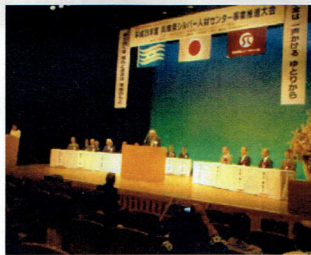
兵庫県シルバー事業推進大会

昨年十月三十一日に神戸市で開催された兵庫県シルバー人材センター事業推進大会において「事業の維持発展を図るうえで、会員の安全確保を最重要課題と位置付け、会員自らの安全意識の高揚を図る」ことの結果において、佐用町シルバーが最優秀賞を受賞しました。