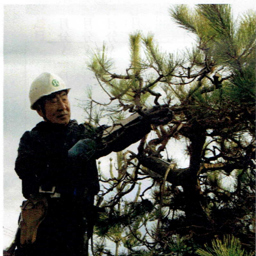
現場で作業されている風景

現在は各地区毎の草刈り・剪定を区分され就業されていますが、今の現状では先々が案じられます。町合併から九年目に入っていますが、シルバーも先の事を考えてみては如何でしょうか。理事会並びに推進員会等で話合う時期が来ているように思われます。事務局を始め発注者・会員相互の三位一体の発展に望みを託したいと思っております。