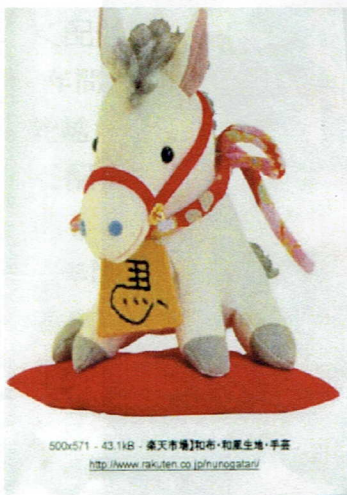
500x571 - 43.148 - 楽天市場「和布・和菓生地・手芸」 http://www.rakuten.co.jp/hurugatanj/

最後になりますが、今年も会員皆様方の健康で明るい幸多い年でありますようご祈念申し上げます。ご挨拶いたします。